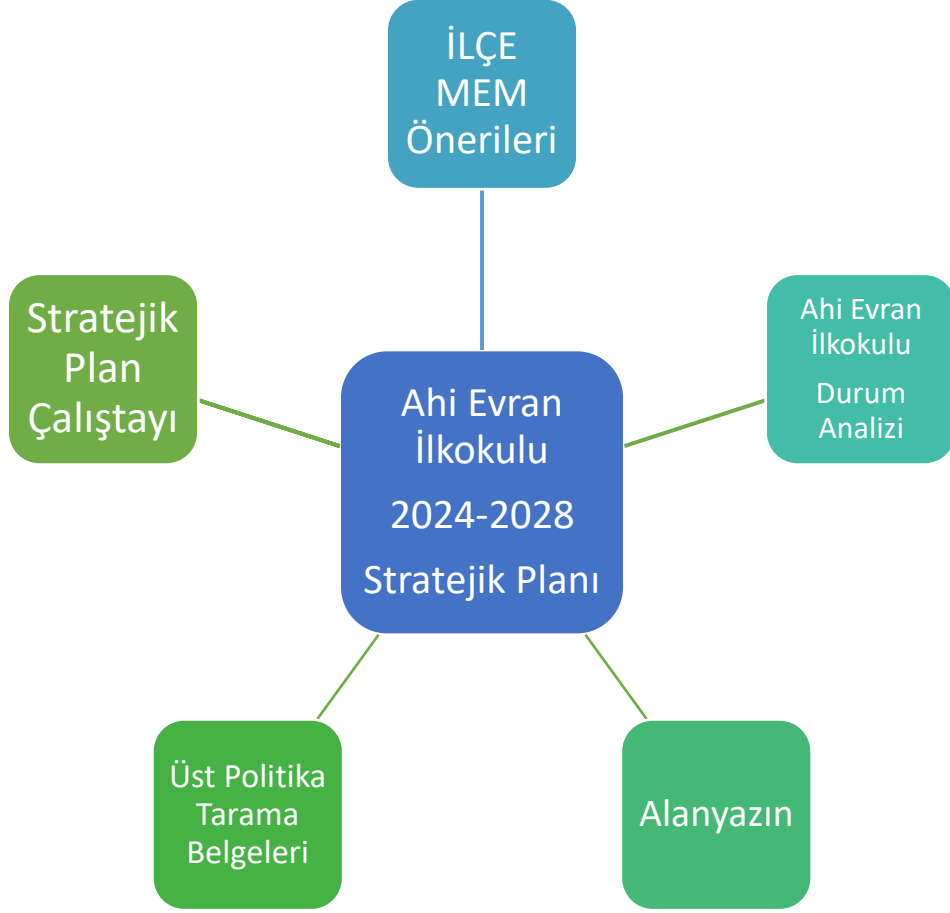
Şekil 2. Stratejik Plan Hazırlık Çalışmaları